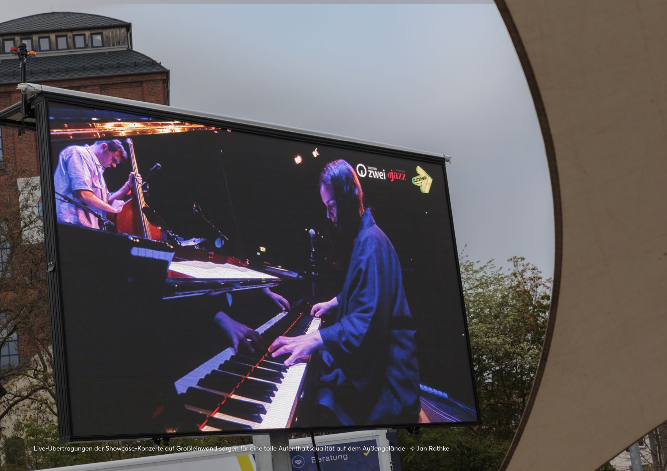
Live-Übertragungen der Showcase-Konzerte auf Großleinwand sorgen für eine tolle Aufenthaltsqualität auf dem Außengelände