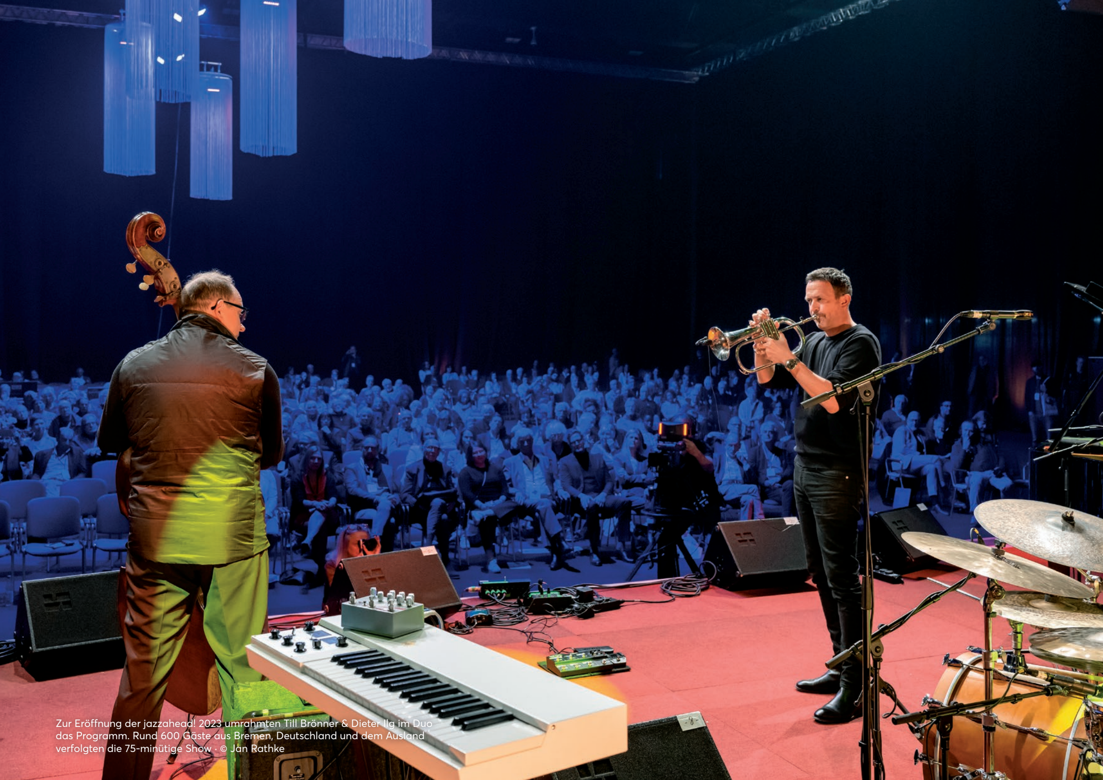
Zur Eröffnung der jazzhead! 2023 umrahmten Till Brönner & Dieter Ilg im Duo das Programm. Rund 600 Gäste aus Bremen, Deutschland und dem Ausland verfolgten die 75-minütige Show