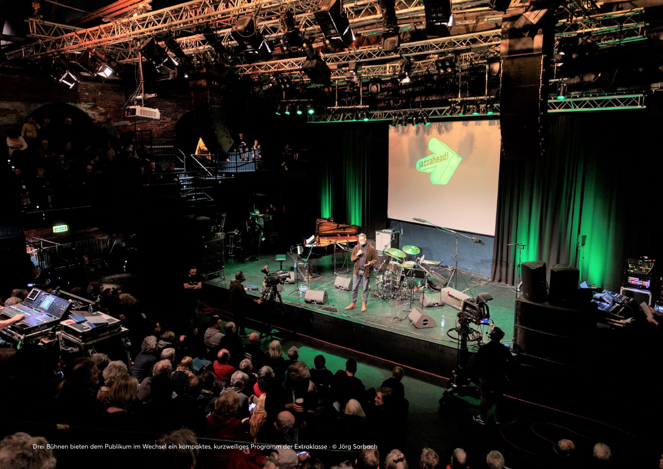
Drei Bühnen bieten dem Publikum im Wechsel ein kompaktes, kurzweiliges Programm der Extraklasse